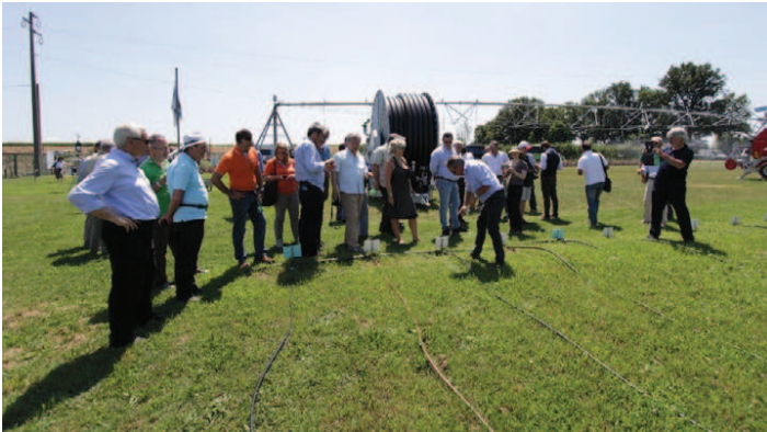
Controllo di un impianto microirriguo