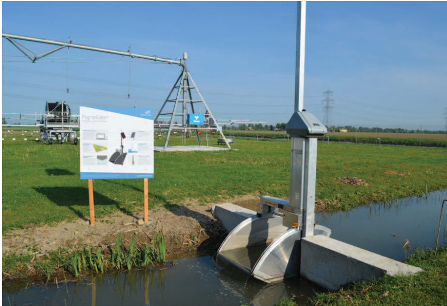
Flume Gate, paratia per controlli automatici nella distribuzione dell'acqua