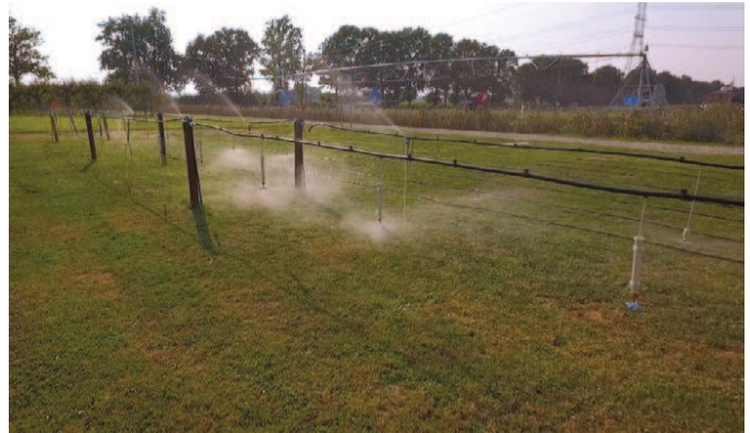
Irrigatori in funzione nel campo dimostrativo

quasi 60 di ricerca nel campo dell'irrigazione di precisione.