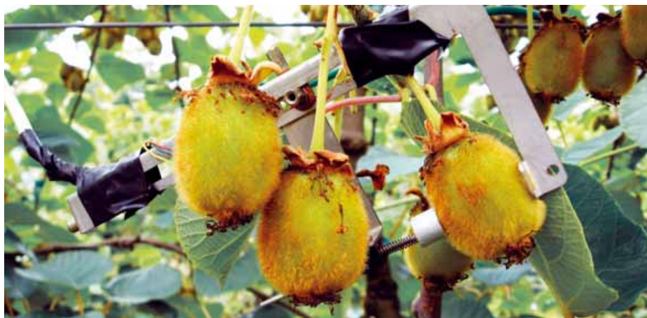
Foto 1 Fruttometro su kiwi a circa 7 settimane dalla piena fioritura. Lo strumento, sviluppato dal gruppo di ecofisiologia dell'Università di Bologna, monitora in continuo l'andamento giornaliero di crescita del frutto

Molti dei sistemi di supporto decisionale disponibili online si basano sul calcolo del bilancio idrico del suolo, ossia la stima teorica del contenuto idrico di un terreno di tessitura e profondità note, basata sulla differenza tra l'acqua in entrata (umidità iniziale, precipitazioni, risalita di falda, ecc.) e in uscita (evapo-