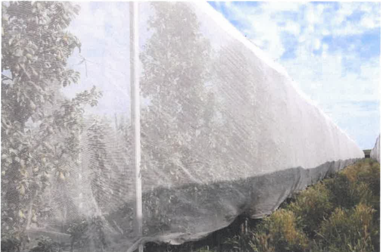
Fig. 5 - L'apezzamento di Abate Fétel a Conselice presso la CAB Massari

Più in particolare, per le produzioni frutticole le seguenti pratiche contribuiscono, in ordine di importanza, alla riduzione delle emissioni di gas serra (GHG):