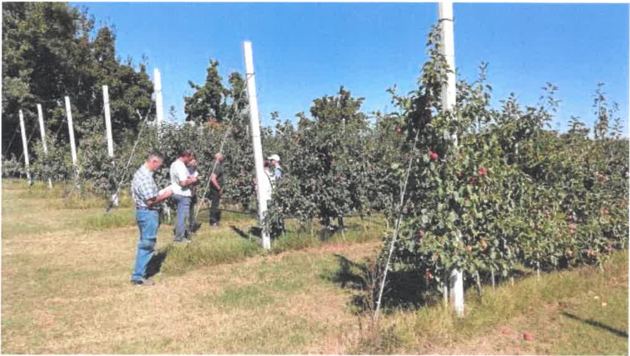
Figura 1 - Uno dei campi di melo bio studiato nel progetto

Determinare gli impatti ambientali, in termini di carbon footprint e i sequestri di carbonio nel terreno durante la coltivazione di alcune specie frutticole biologiche, ai fini di individuare e quantificare le pratiche maggiormente volte alla mitigazione delle emissioni di GHG (Greenhouse gases): questo è RIASSORBI (Riduzione gAS Serra agricOltuRa Biologica), il Gruppo operativo per l'innovazione (Goi) finanziato dal P.S.R. della Regione Emilia-Romagna.