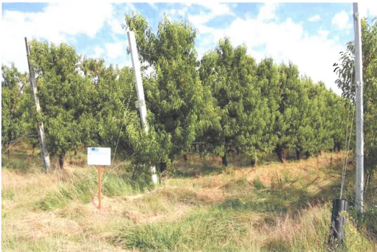
Figura 2 - Il pesco monitorato presso la CAB Massari a Conselice (RA)

Considerata la scarsità di fertilizzanti organici presenti nella banca dati Ecoinvent, a cui si rifà il codice di calcolo SimaPro, i prodotti realmente distribuiti sono stati frequentemente equiparati a quelli disponibili (in Ecoinvent v.3.4 sono presenti compost, horn meal e poultry manure dried). In particolare il digestato, prodotto nell'impianto della CAB Massari, è stato equiparato al compost, alcuni organici sono stati sostituiti con la cornunghia del database, altri organici ancora sono stati equiparati alla pollina essiccata.